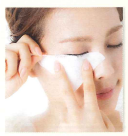
3 下まぶたのメイクをオフ