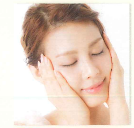
2 手で触れれば、肌情報がわかる