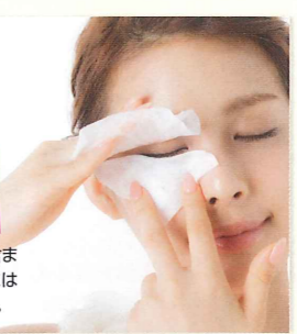
1 色素を肌につけないように

洗いすぎはダメですが、だからといって汚れを落とさないのも禁物! アイメイクの残りは乾燥や刺激などあらゆるトラブルの原因になりますから。