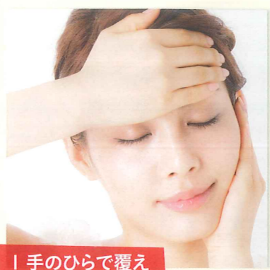
1 手のひらで覆えば、浸透力UP

自分の肌を知る探知機であり、浸透を促すアイロンであり、マッサージ器具であり、心を安心させる癒しでもある手。化粧品を塗る時も、手をフル活用して。