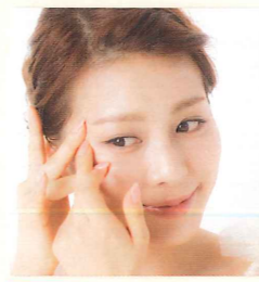
3 シワやたるみも塗り方次第!