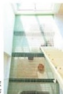
グレーチング床イメージ

屋根には大きなトップライトを設置。さらに2階の廊下の床に一部グレーチングを設置して「光床」にし、トップライトからの太陽の光がLDKに降り注ぎます。「昼間でもやや暗い」という問題も解消されます。階段はリビング階段にするために位置を変更。家族のコミュニケーションも取りやすくなります。2階の子ども室はお子さんの成長に合わせて多目的に使えるよう建具付の続き間としました。バルコニーを玄関上の南向きに設置したので、これからお子さんの洗濯物が増えても乾きやすく、家事効率がグンとUPします。