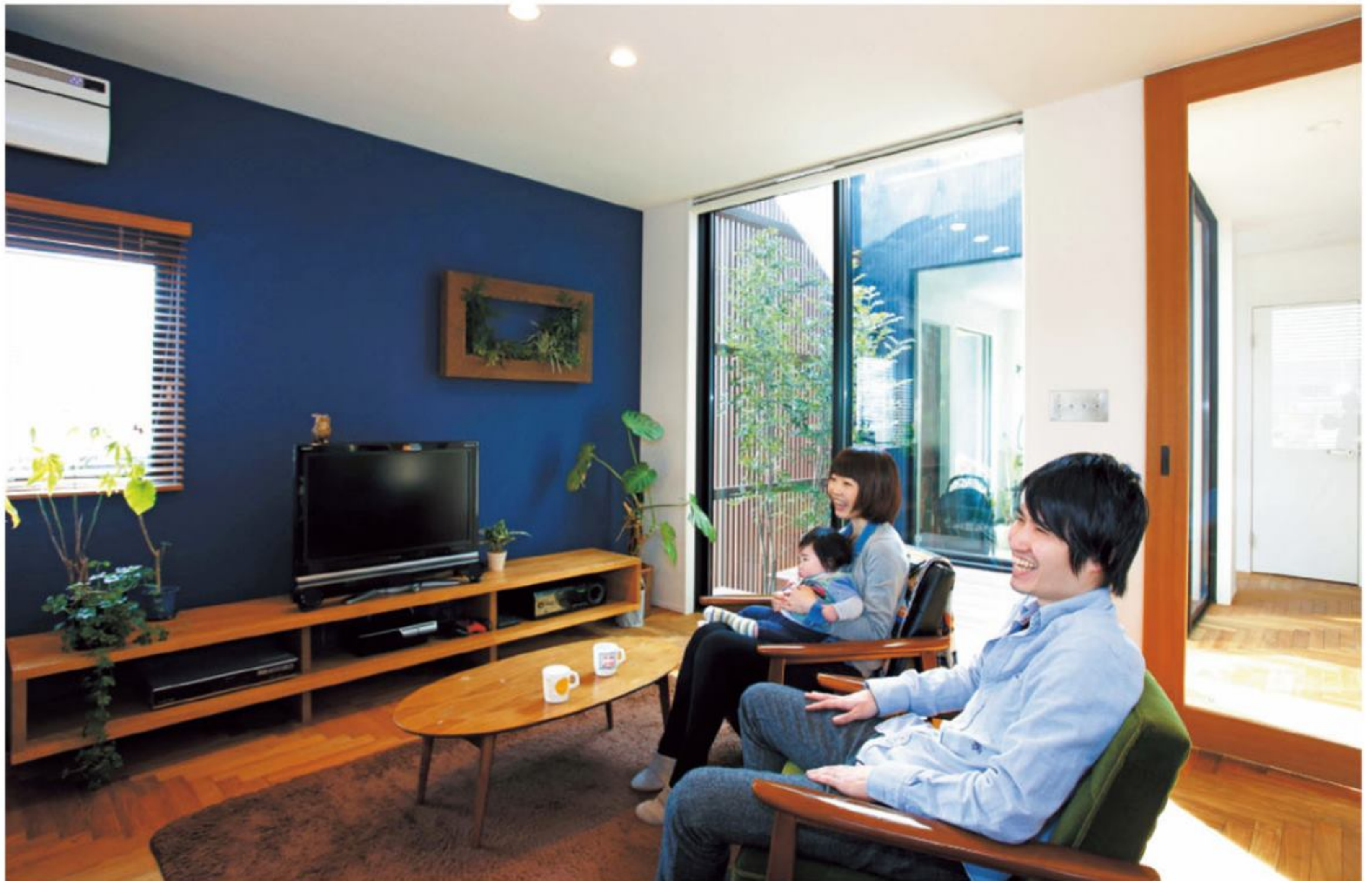
深いブルーの壁とチークの無垢材をヘリンボーン貼りにしたシックな床が、スタイリッシュなカフェを思わせるリビング。中庭のグリーンと調和し、お洒落で心地よい空間に。