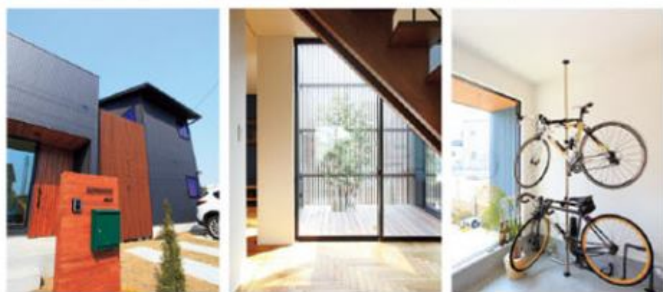
(左) グループ会社と連携し土地探しから親身に対応した同社。シンプルでありながら存在感のある佇まいが、ご夫婦のお気に入りだとか。(中央) 1階和室からもホール越しに中庭が見える。中庭には縦格子を設けて、外からの視線を遮りながら光と風を取り入れる工夫を。(右) 「自身でカスタマイズしたロードバイクをリビングから眺めたい」というKさんの要望を叶えた。快適さと同時に遊び心があふれる住まいに。