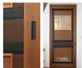
木の扉に本革をあしらった逸品だ

地元・兵庫の地場産業である製革。モデルハウスでは新しい試みとして、天然木と革という異素材ミックスでオリジナル制作したドアをはじめ、手が触れる収納の手がかりや、飾り棚の壁など随所に革を使用している。