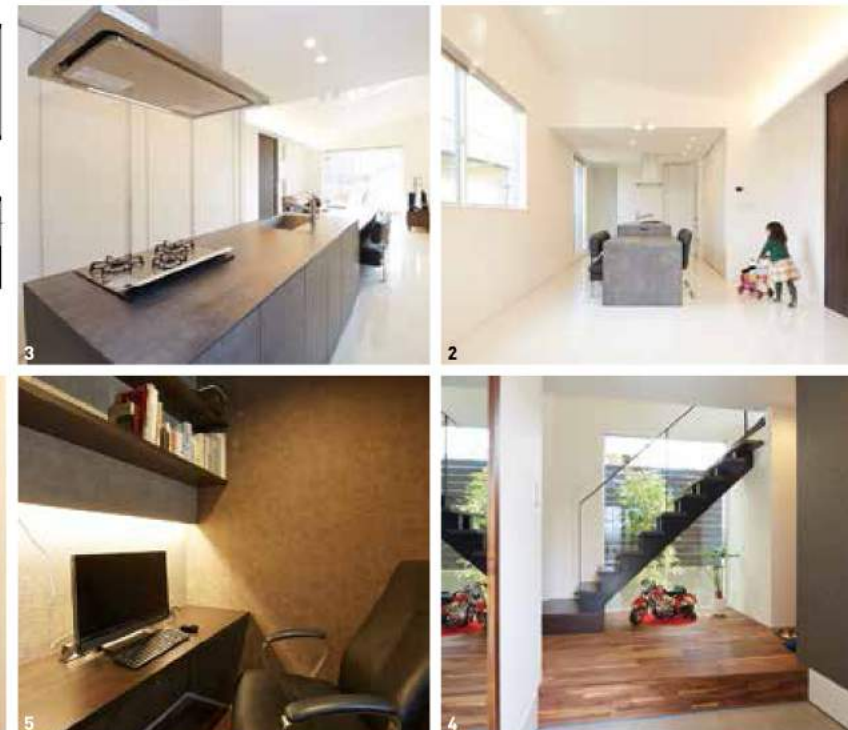
1~6/外観は塗り壁と板張りで風合いよく。木質感のある1階に対して、2階はガラッと雰囲気を変えてシンプルモダンに仕上げている。玄関には常緑樹が美しい坪庭、2階リビングには桜並木の借景をとり込む大きな窓を設け、家に居ながらにして自然の潤いを感じられる暮らしを叶えている(このページの写真はすべてT氏邸)