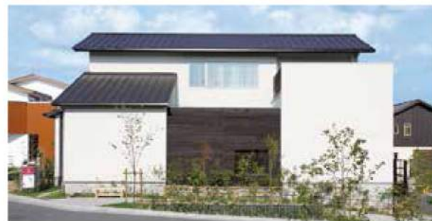
自然とのふれあいをテーマに、中庭を囲むようにコの字型に居住空間を配置