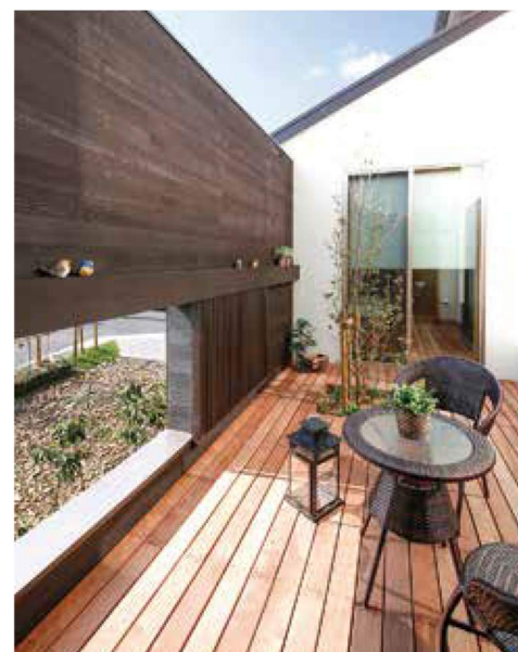
ウッドデッキの増設をはじめ、外構も提案可能