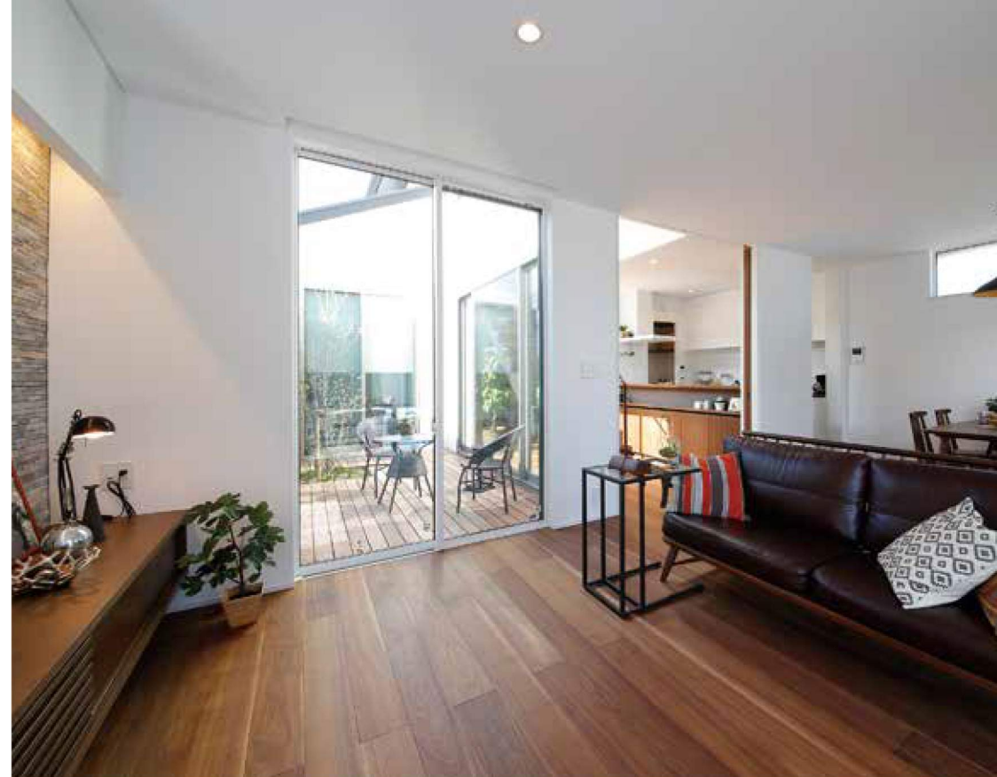
木を使ったシンプル&ナチュラルな空間づくりが得意。造作家具などインテリアも含め、よき相談相手になれる建築のプロ集団だ

楽しい思い出の瞬間がよみがえる家族のギャラリースペース。ちょっとしたスペースも無駄にせず、サプライズを盛り込み、提案している