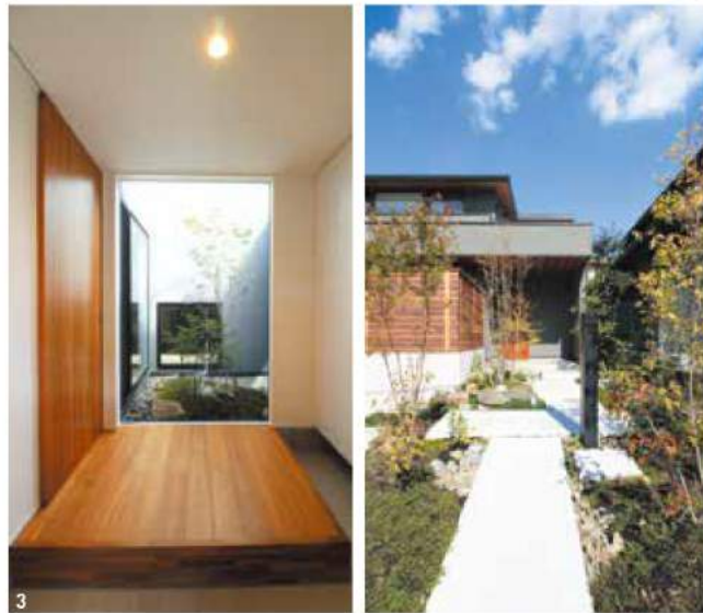
1/借景の緑、中庭からの風、吹き抜けが落とす光、そして木をふんだんに採り入れた空間。設計のチカラですべてがひとつになり、敷地の魅力を何倍にもしている。また、それぞれの部材の素材感や色合わせを熟考した統一感のある空間のなかにも、さりげないセンスとこだわりが感じられる 2/水平ラインを意識したデザイン。レッドシダーを貼ったポーチ軒天が、内と外とを自然につなぐ 3/雑木のアプローチ、美しい中庭が潤いを与える玄関。この中庭はリビング、そして和室からも眺めることができる（見開きページの写真はすべてT様邸）