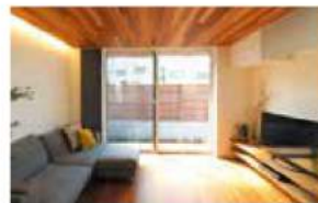
庭とつながる、開放感あふれるリビング

中庭やバスコートを含む、大小さまざまな庭が設けられ、植栽が暮らしを包み込んでいる。また、建築士が視界が抜けるところをうまく活かし、緑あふれる借景も楽しめる家に、