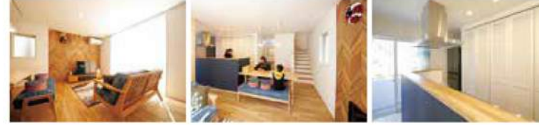
S 氏邸 敷地面積 / 132.25㎡ 延床面積 / 109.35㎡ 本体価格 2000 ~ 2500万円

家づくりを始めた当初は、住宅展示場などあちこちの会社でプランを描いてもらうもの、なかなかしっくりと来ず、依頼先が決まらずに…。本屋で購入した SUUMO にイメージに合う家を見つけた。早速、その家を建てた会社を訪ねた。それが Labo でした。予算が 1000 万円台であること、たくさんの希望を伝えたと「大丈夫ですよ！」と拍子抜けするくらい快諾！とんとん拍子に話が進み、依頼を決意。