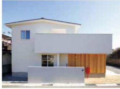
S 氏邸 敷地面積 / 129.86㎡ 延床面積 / 102.68㎡ 本体価格 1500 ~ 2000万円

家づくりを始めた当初は、住宅展示場などあちこちの会社でプランを描いてもらうもの、なかなかしっくりと来ず、依頼先が決まらずに…。本屋で購入した SUUMO にイメージに合う家を見つけた。早速、その家を建てた会社を訪ねた。それが Labo でした。予算が 1000 万円台であること、たくさんの希望を伝えたと「大丈夫ですよ！」と拍子抜けするくらい快諾！とんとん拍子に話が進み、依頼を決意。