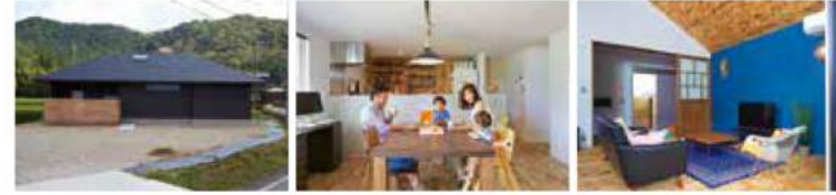
T 氏邸 敷地面積 / 66.06㎡ 延床面積 / 91.29㎡ 本体価格 1500 ~ 2000万円

こだわり向き合ってくれた建築士さんの存在が大きかったですね。直接、打ち合わせができ、想いが伝わり、期待以上のアイデアが加わった提案に惹かれました。急かさず、一つひとつ納得するまで考えて進められました。予算も譲れない点でしたが、一般住宅ではあまり採り入れないような素材など、カッコよくコストパフォーマンスに優れたものを探して採り入れてくれたおかげで仕上がりのいい感じ！