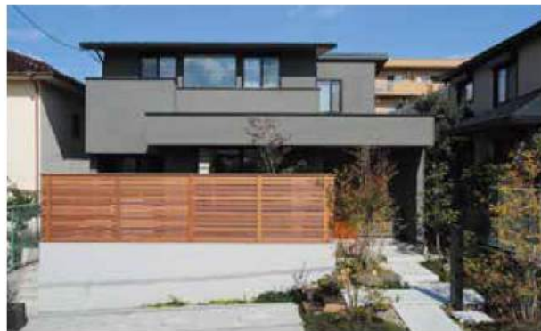
水平ラインを意識したゆとりのデザイン。豊かな表情を楽しみ塗り壁で仕上げた

や中庭を眺められる大きな開口を持つ開放的でダイナミックな住まいになっている。地震への備えをきちんとしながら、木造住宅ならではのプランの自由度や木のぬくもりが感じられる住まいが完成。こだわりを可能にする工法の提案力も同社の魅力だ。