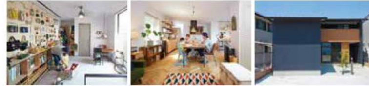
F 氏邸 敷地面積 / 499.30㎡ 延床面積 / 128.14㎡ 本体価格 2000 ~ 2500万円

Labo の施工例を見て、「コレだ！」と。早速、問い合わせたところ、その家を設計した建築士さんに会えることに。僕たちの想いをじっくりと聞き、その場でたくさんの提案をしてくれました。そして、そのまま我が家の設計担当にもなってくれました。憧れだった土間は、中庭やリビングと回遊性を持たせたプラン。趣味に没頭しながらも、家族とのつながり、自然とのつながりが感じられます。