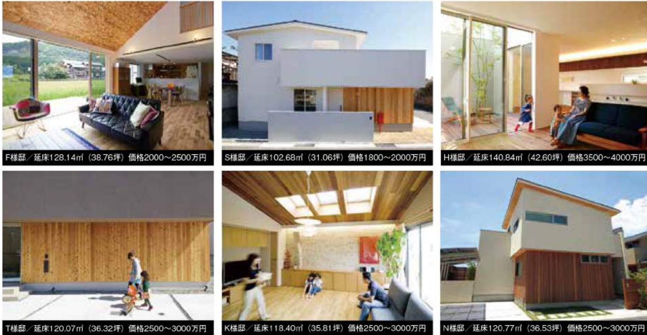
F様邸 / 延床128.14㎡ (38.76坪) 価格2000～2500万円

阪神間～明石、加古川、姫路エリア、北摂まで幅広くカバー。私たちの予算で建てたこだわりいっぱいの家