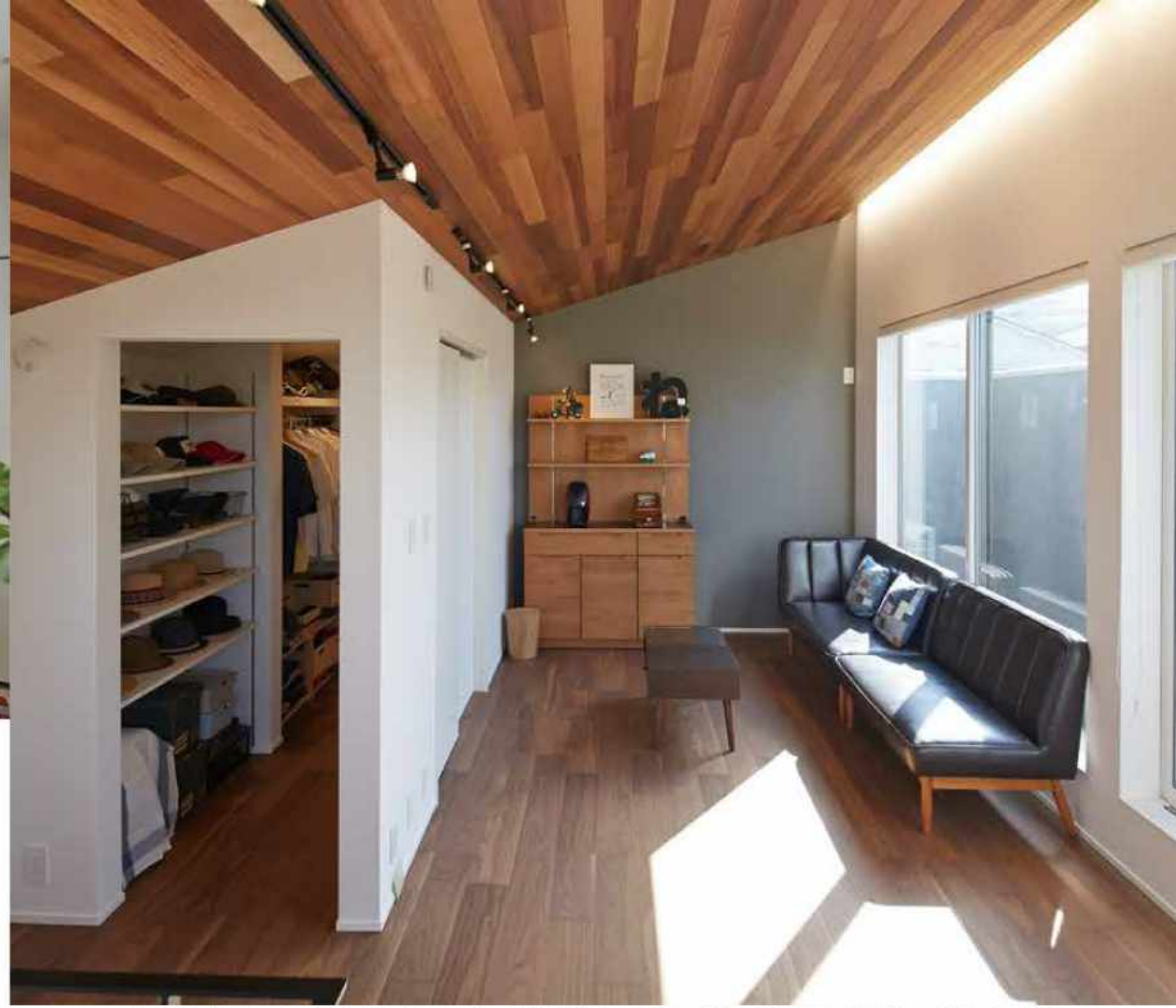
Yさんの暮らし方に合わせ、メインリビングは2階に。プライベート感のある家族だけの空間になった。質感のいい木が豊かで上質な暮らしをつくる (見開きページの写真はすべてY氏邸)