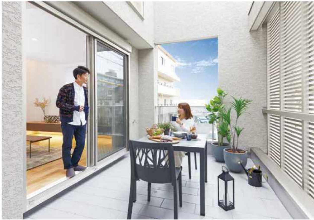
西宮モデル / 大きな空が広がる、屋上のある家