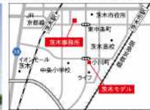
茨木事務所：茨木市駅前1-8-20 P有り

「もっと、Laboの家づくりを知りたい」という方は、茨木や西宮のモデルハウスへ行こう。スタッフは常駐していないので、まずは希望日の予約を。また、「家づくりについて相談したい、詳しい話を聞きたい」という方は、事務所まで。いずれも設計スタッフが直接対応するので、予算や間取り、敷地のことなど、疑問や悩みなど何でも相談してみよう