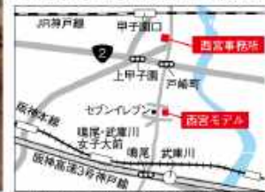
西宮事務所：西宮市甲子園口2-20-20 P有り