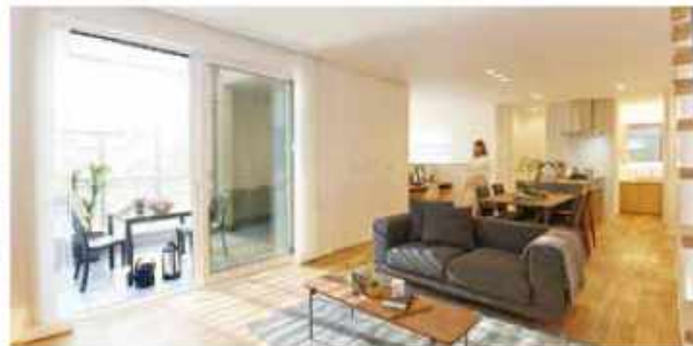
プライバシーを守りながら、光と風を採り込み、自然（ソト）とつながる家