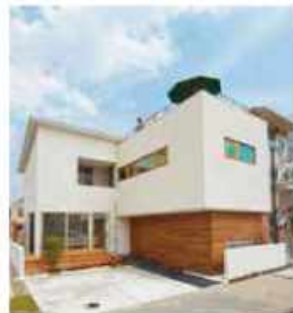
使い方がいろいろ、楽しみが広がる、屋上のある家