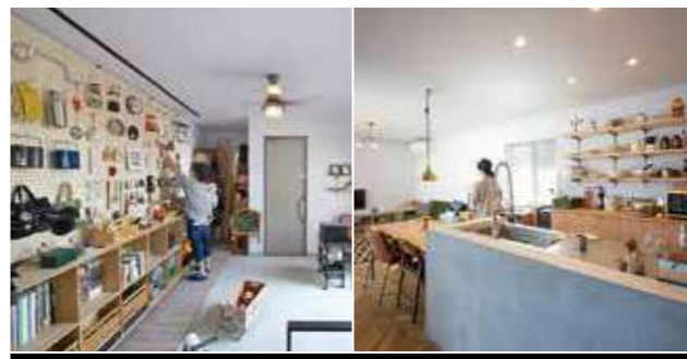
50名超の建築プロ集団。設計者が直接の窓口