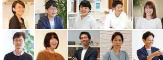
中古物件の探し方から相談でき、CG完成予想パースを使った打ち合わせも好評