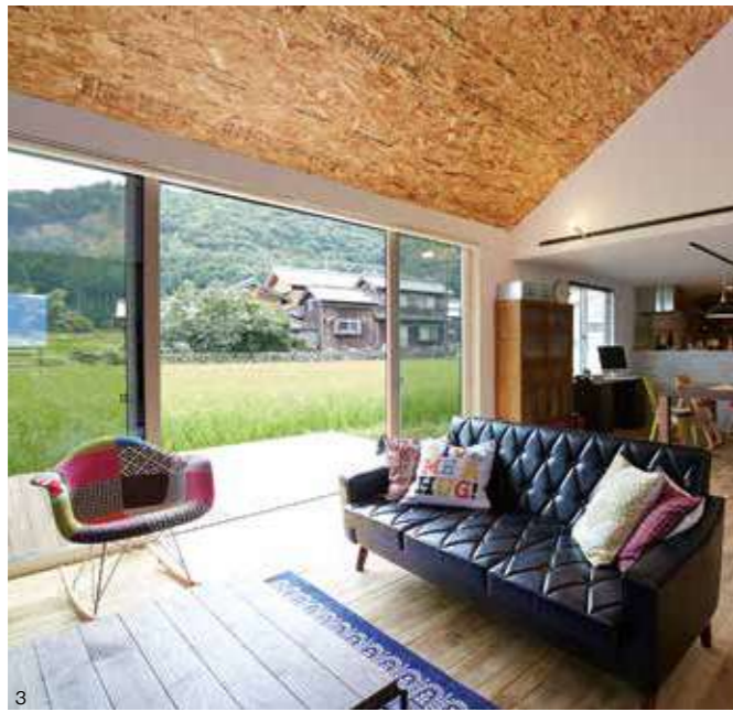
1 / 土間リビングのある家。お気に入りのアウトドア用品は、有孔ボードに取り付けた壁や造作の木箱に飾るように収納 2 / 動線のいいアイランドキッチン 3 / 構造用合板を貼った天井、ヴィンテージ加工された木の床、カッコいいインダストリアルなテキスト 4 / 天然木のぬくもりが感じられる家。木の濃淡が美しいレッドシダー貼りの天井が印象的