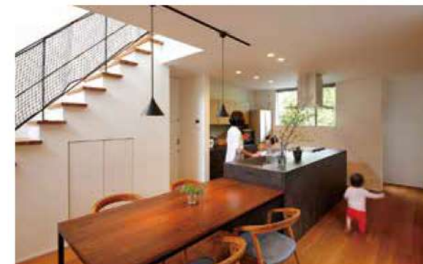
美しい情景を取り込むキッチン。敷地を読み解き、暮らしの質を高める設計が魅力

が！木を使ったシンプルな大人のデザイン。建築士と直接話せて、言葉にできない想いで涙でもらえたことに感激。「この人、この会社なら！」と、その日の帰り道には夫婦一致で決断。それまでの悶々とした悩みが嘘のように解消されました」とT様。