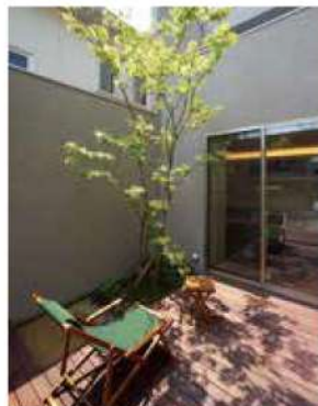
家に居ながら「外」を感じられる中庭