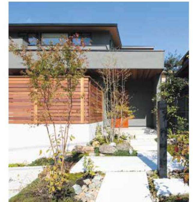
外観にも塗り壁や木の濃淡が美しいレッドシダーの軒など素材感の豊かなものを採用