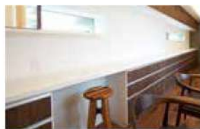
仕事と家事を両立するワークスペース

テレワークやオンライン授業などが進み、ライフスタイルが変化しつつある時代。H様邸では在宅勤務にも対応できるワークスペースや中庭を設け、快適なおうち時間を過ごされている。