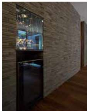
自宅でお酒を楽しめるホームバー