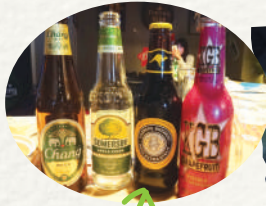
これがこぼれました